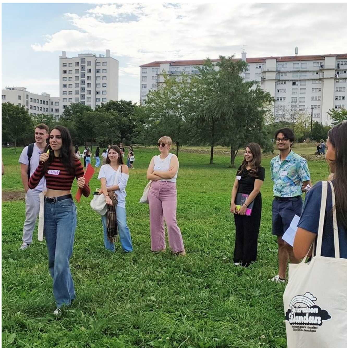
Crous de Lyon

Publié le 26 août 2025, Mis à jour le 3 septembre 2025