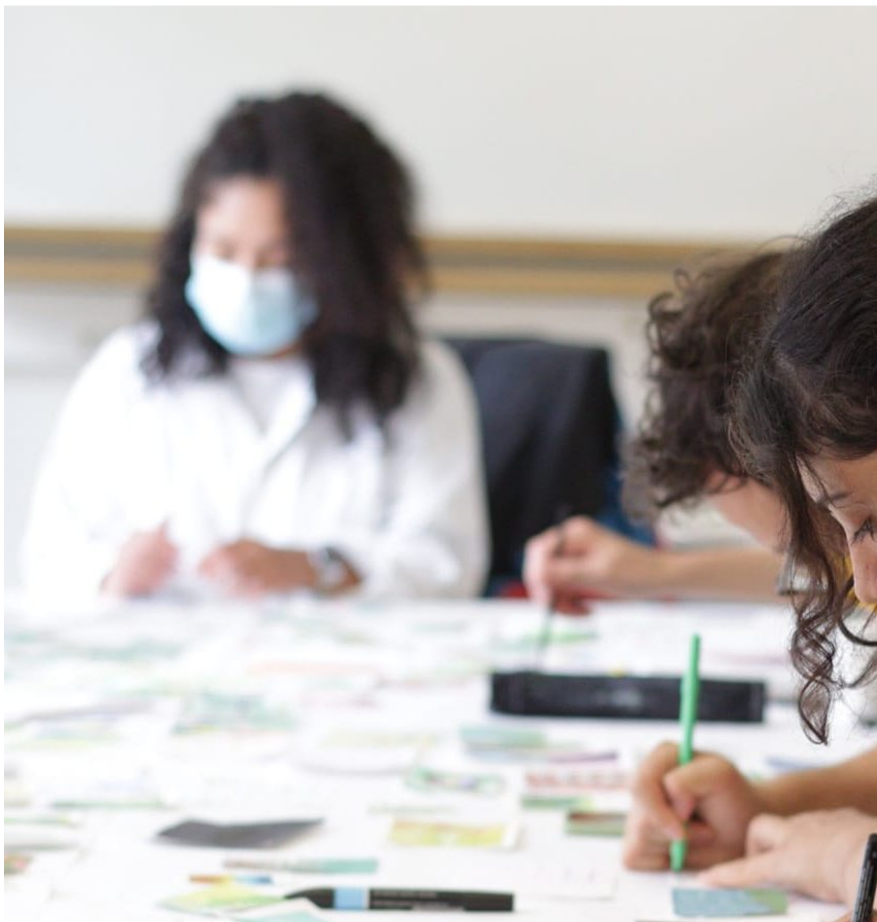
Crous de Strasbourg

Publié le 26 août 2025, Mis à jour le 3 septembre 2025