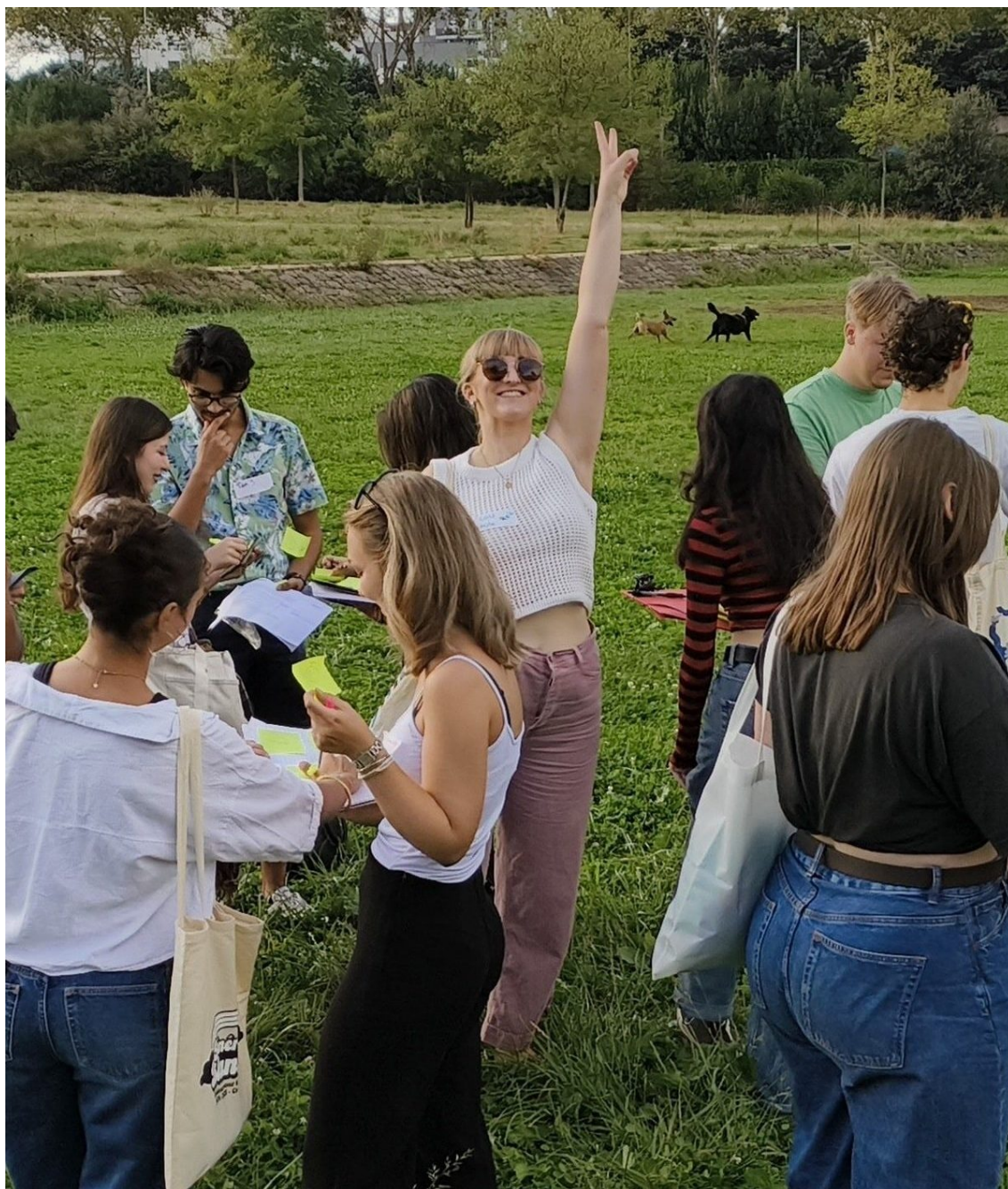
Crous de Lyon

Publié le 26 août 2025, Mis à jour le 3 septembre 2025